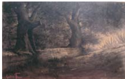
Carvão 1944 Dim.: 83cm x 117 cm Colecção Ferreira de Almeida FA-120

Este desenho a carvão sobre papel representa uma paisagem sombria, iluminada apenas por escassos raios de luz que conseguem atravessar o denso avoado.